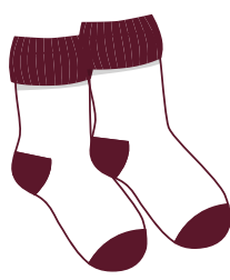
スポーツソックス